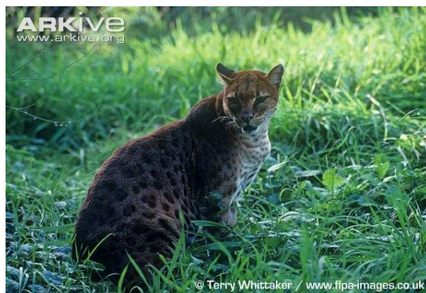
Caracal aurata celidogaster

In Azië leeft ook een goudkat, de Aziatische goudkat . Hij lijkt wel op de Afrikaanse goudkat, maar ze zijn niet verwant aan elkaar.