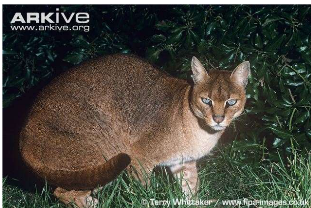
Caracal aurata aurata