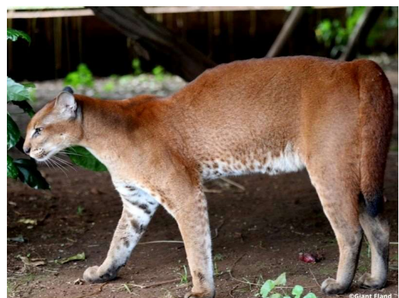
Links de caracal en rechts de Afrikaanse goudkat